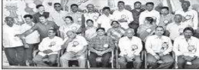
ఒక్కటైన పూర్వ విద్యార్థులు

స్నేహాన్ని మించిన బంధం లేదు పూర్వ విద్యార్థులు తమ, తర్రాలు, అనంతవరం, హైదరాబాద్లో పాలు బెంగళూరు వంటి నగరాల్లో వివిధ రంగాల్లో ఉద్యోగాలు చేస్తున్నారని పూర్వ విద్యార్థి శ్రీరాములు తెలిపారు. అంతా ఒకే వేదికపై రావడం చాలా సంతోషంగా ఉంది. అందరూ ఉన్నత స్థాయిలో స్థిరపడటం సంతోషం. స్నేహాన్ని మించిన